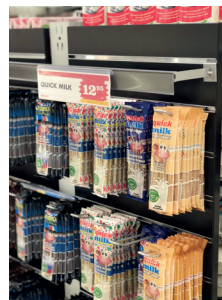
Spjut för spårpanel. Dubbel eller enkel 150, 200 eller 300mm