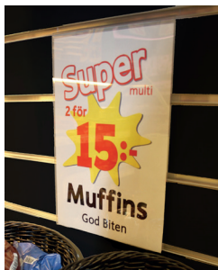
Plastficka för spårpanel. Storlek: A4, A5 eller A6.