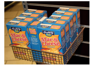
Trådkorg för spårpanel 250x250mm