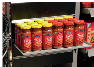
Plåthylla för spårpanel, grålackerad. Finns i storlekarna: 280x100, 280x200, 345x255 eller 390x200mm