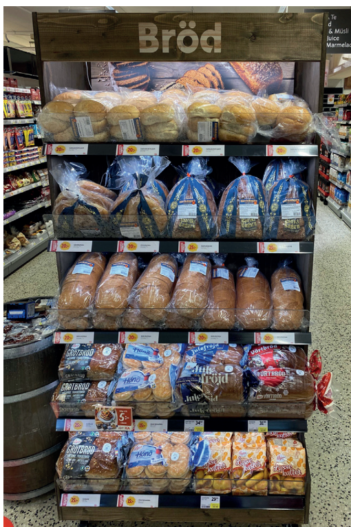
Brödexponering 2000x900x600mm, brun.