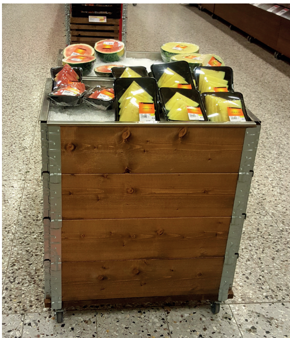
Isdisk kvartspall brunbets.