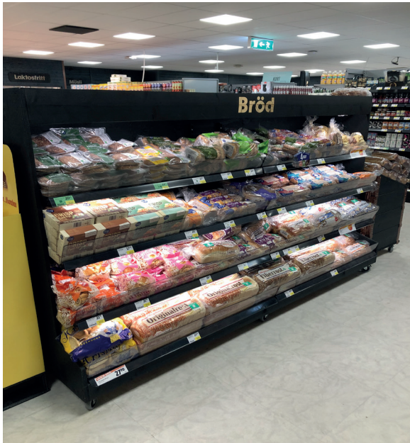
Brödexponering 2480x1600x600mm, svart.