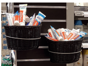
Expokorg med korgring stor, liten eller baguettekorg