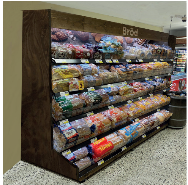
Brödexponering 1800x2000x600mm, brun.