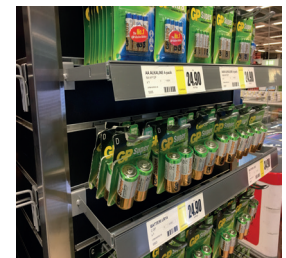
Etiketthållare för spårpanel