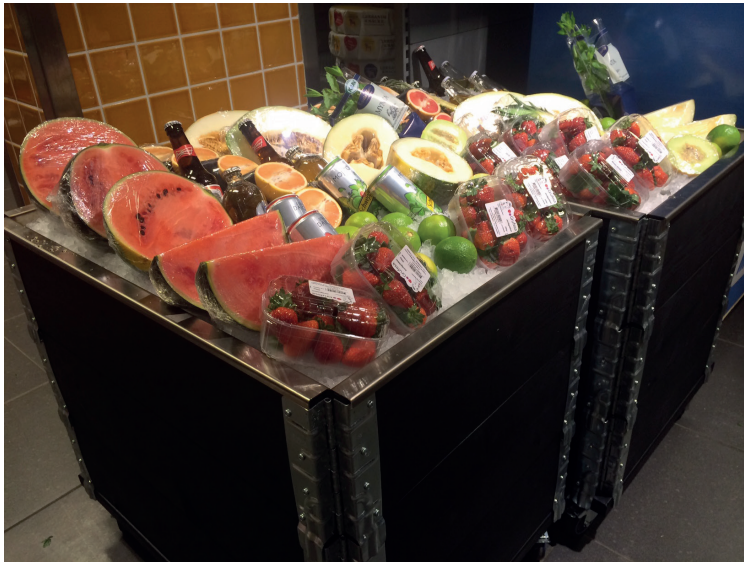
Isdisk halvball svart.

Isinsatsen har ett dropprör genom vilket vattnet rinner ner i en 20L dunk. Handtag i isinsatsen gör det lätt att lyfta den för att tömma dunken. Djupen på insatserna är 120mm. Isdisken finns i storlekarna halvball: L = 800mm, B = 600mm, H (med 3st kragar) = 720mm, eller kvartspall i måtten: L = 600mm, B = 400mm, H (med 3st kragar) = 720mm. Standardfärgerna är: svart, rött, vitt, brunt eller grönt. Andra färger på pallkragen och beslagen går att få mot en tilläggskostnad.